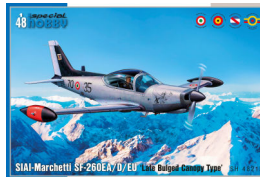
4482 SF-260 Exhausts