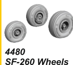
4480 SF-260 Wheels