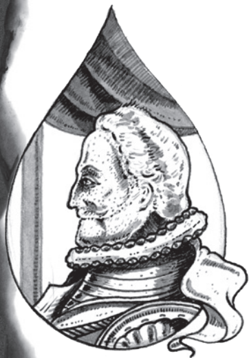
císař Matyáš Habsburský

Na pravém břehu Vltavy se zatím chystali k boji. Někteří šlechtici se stáhli