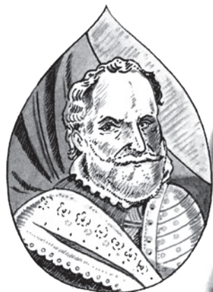
Jindřich Matyáš Thurn

Rudolf to přijal, ale zavřel se ve svých komnatách. Nechtěl být svědkem korunovace svého bratra. Matyášovi vložili na hlavu korunu v Chrámu svatého Víta v květnu 1611.